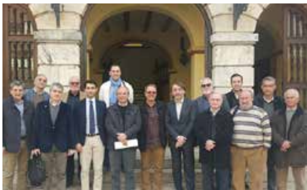
Alcaldes de la Ribera

Així mateix, ha mantingut una trobada, junt amb el director general d'Obres Públiques, Transport i Mobilitat, Carlos Domingo, amb els alcaldes dels municipis de la Ribera Alta (Alberic, Alginet, Benimodo, Carlet, l'Alcúdia, Massalavés, Manuel, Senyera, Sant Joanet i Villanueva de Castellón) per a abordar diferents assumptes relacionats amb el transport de la comarca.