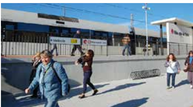
Riba-roja de Túria