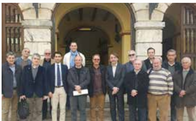
Alcaldes de la Ribera