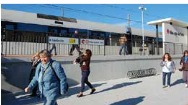
Riba-roja de Túria