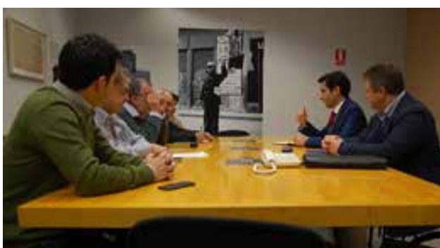
Plataforma 15 minutos de La Línea 2