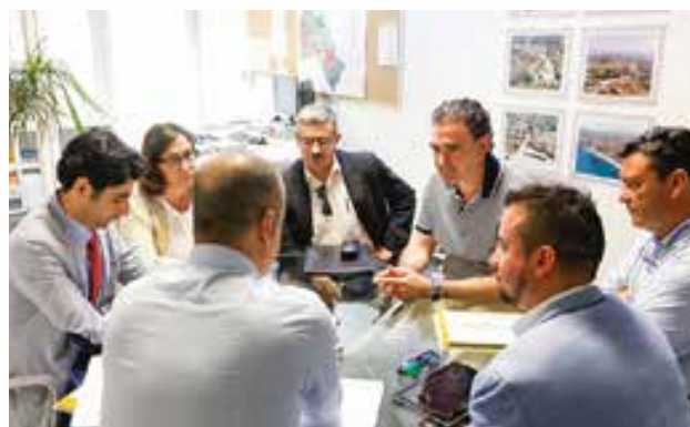
Alfàs del Pi

Los alcaldes de municipios por los que el TRAM circula se han reunido con el director gerente de FGV, preferentemente de la Línea 9 Benidorm-Dénia, para debatir distintas cuestiones. Tales son los casos de Teulada, Dénia, Benissa y Alfàs del Pi.